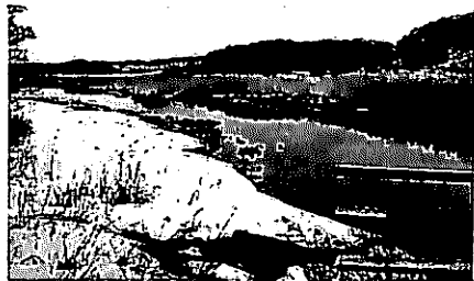
ウトナイ湖に流れ込む美々川。放水路の掘削による地下水脈の寸断で、流域の環境破壊が心配。