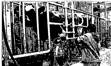
到着初日の搾乳風景。配管が未完成のためバケツで牛乳を搾る