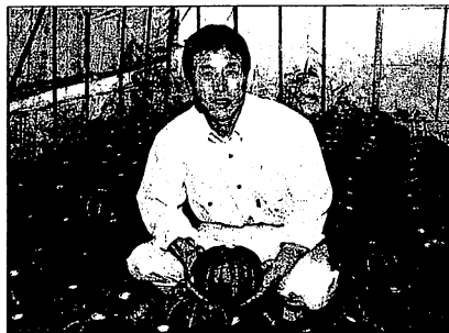
「興業種の連携で雇用の創出や農村の再生につなげたい」と話す有田社長

「この人（青果業者のアドバイスは大きく、有機農産物に参入しやすかった。三越でうちのカボチャを買い求める人の「昔の味がする」という声をNHKが全国ニュースで放送してくれた、高齢者から注文が相次ぎました。一年目は素人だから、なんでも受け入れてやっ