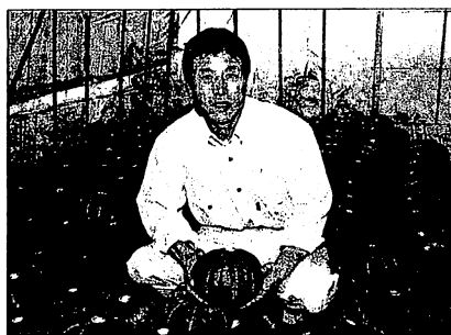
「興業種の連携で雇用の創出や農村の再生につなげたい」と話す有田社長

「この人（青果業者のアドバイスは大きく、有機農産物に参入しやすかった。三越でうちのカボチャを買い求める人の「昔の味がする」という声をNHKが全国ニュースで放送してくれた、高齢者から注文が相次ぎました。一年目は素人だから、なんでも受け入れてやっ