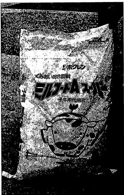
北海道産の3頭の感染牛に共通して与えられていたホクレンの代用乳

狂牛病の感染が確認された四頭の乳牛すべてに、全農系の科学飼料研究所の高崎工場が製造した代用乳（商品名は「ミルフードAスーパー」と）びゅあ