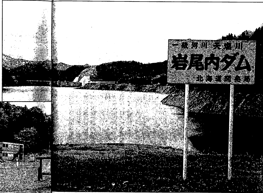
岩尾内ダムが完成したころ、地元自治体などは観光や地域振興に大きな期待を寄せた。完成から30年たったが、湖畔のホテルは取り壊され、ドライブインも廃業した(写真左)

市街地から十数キロほど行ったダム湖のほとりに町内の有志が出資して観光ホテルを建てたが、営業不振で数年前に廃業し、跡地は更地のままになっている。道道沿いにあった一軒のドライブインも営業をやめた。使用料を徴収しないので夏場にはキャンプ場がに