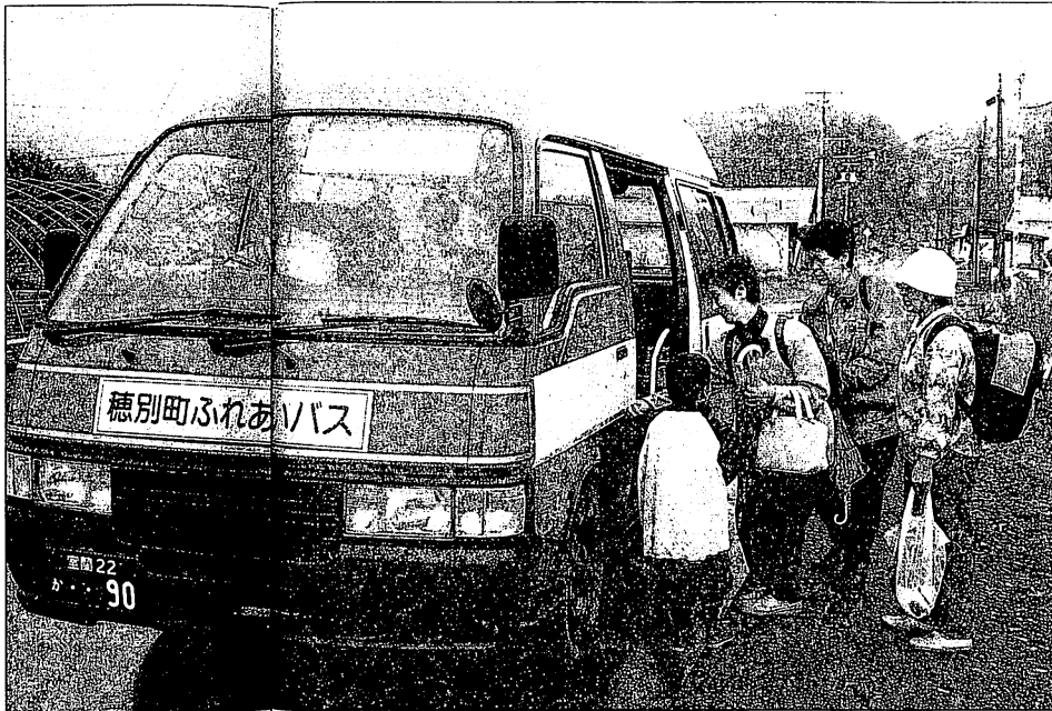
穂別町市街地と栄地区を結ぶ路線は15人乗りのミニバスを運行。病院や学校に通う人たちに安心感を与えている。

市街地の停留所で年配者の六人が乗車する。前に座った六十代の女性に聞いてみると、乗った人のほとんどが朝のバスで町立病院に行った帰りとか。