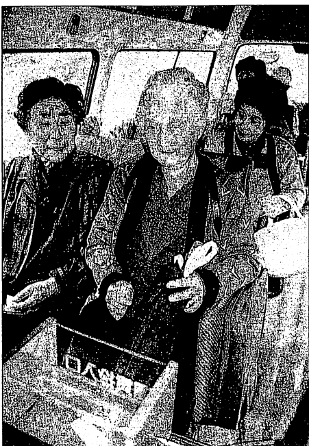
「ふれあいバス」の車内では体調や天候の話に花が咲く

この「ふれあいバス事業」は、ミニバスから中型までの四台を使い、西・東・北の三ゾーンで運行している。今年になって運行ルートを延長した路線