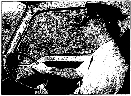
バスの運行が始まってから、若手の運転員4人が町内に移り住んだ